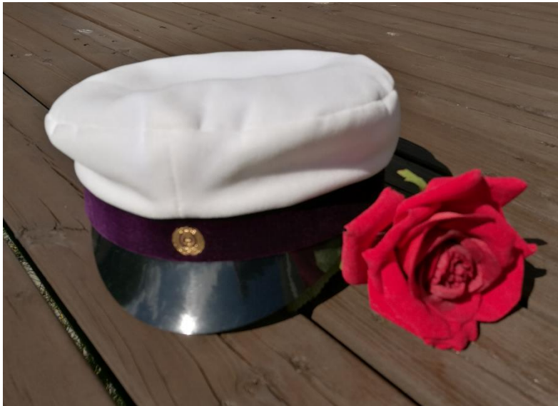
Kuva: Tarja Nykänen 2020